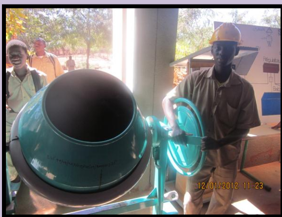
Les élèves du lycée professionnel régional Guimbi OUATTARA ont, à l'occasion, organisé une journée « portes ouvertes » qui a permis de présenter aux autorités et au public les différentes filières de formation de leur établissement.