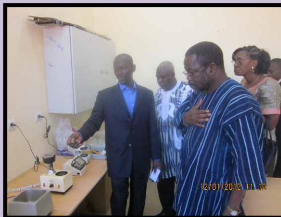
Tout l'équipement de l'atelier a été présenté au Ministre des Enseignements secondaire et supérieur. A l'arrière-plan, Monsieur le Gouverneur de la Région des Hauts Bassins et Madame le Haut-commissaire du Houet