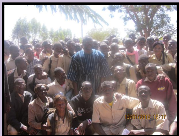
Le ministre posant avec les élèves, à la fin de sa visite dans le lycée