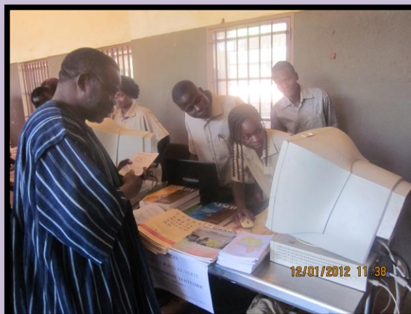
Séance de démonstration de savoir-faire de la filière enseignement général du lycée, en présence du ministre de tutelle