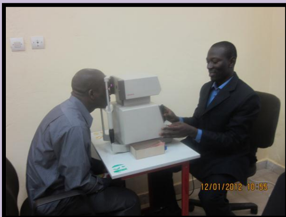
Simulation d'un diagnostic des défauts de l'œil