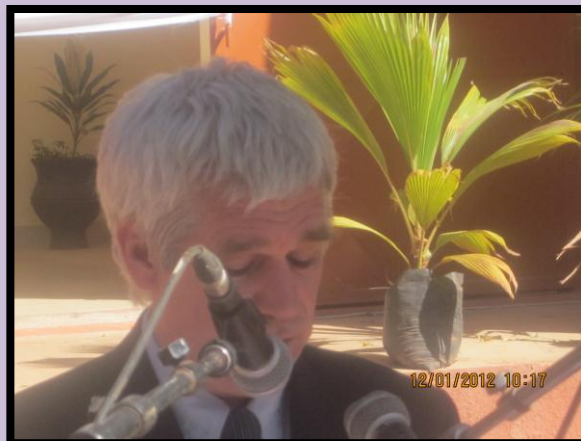
Le Chef de la délégation autrichienne prononçant son discours